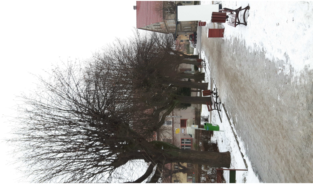
Fot. 3. Chodnik z kostki betonowej po wschodniej części placu.