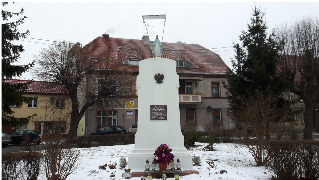
Fot. 1. Pomnik w centralnej części placu.