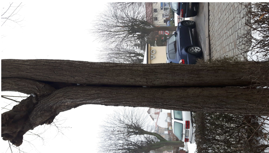
Fot. 6. Ogłowiona lipa z uszkodzeniami pnia.