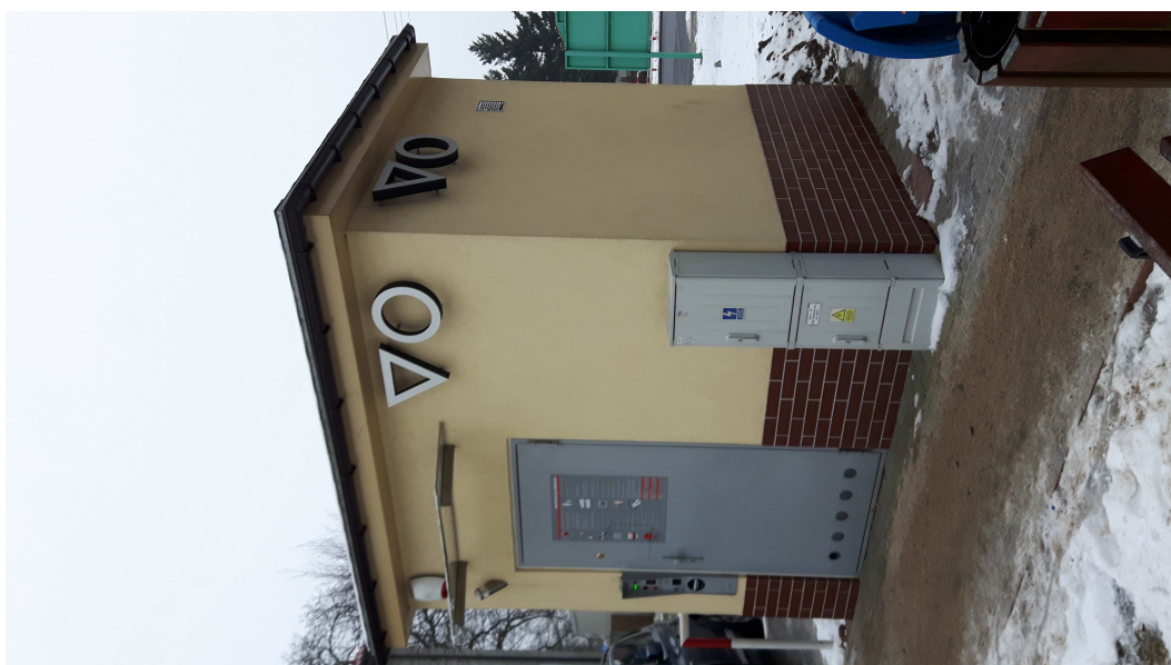
Fot. 2. Budynek z toaletami miejskimi.