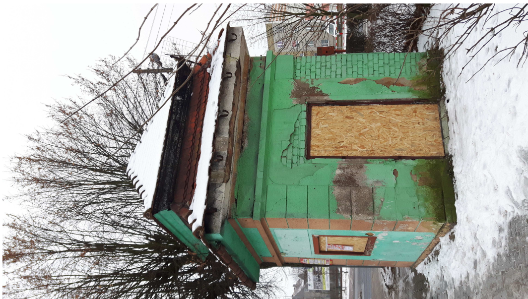
Fot. 5. Budynek należący do prywatnego właściciela znajdujący się w obrębie placu.