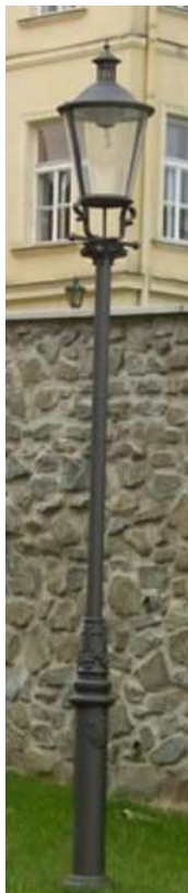
Rekomendowana latarnia parkowa

Rury powinny zapewnić możliwość wymiany kabli bez konieczności rozbierania nawierzchni trwałych typu kostka brukowa, granit, kamień, beton, itp.