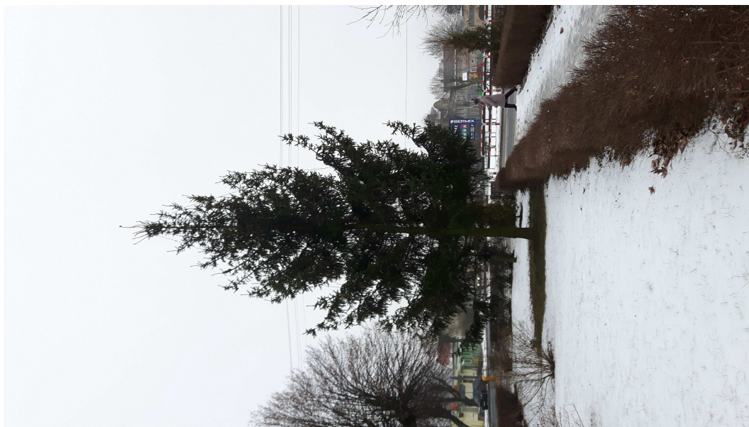
Fot. 4. Fragment kwatery obsadzonej żywopłotem. Na dalszym planie świerk pospolity (Picea abies).