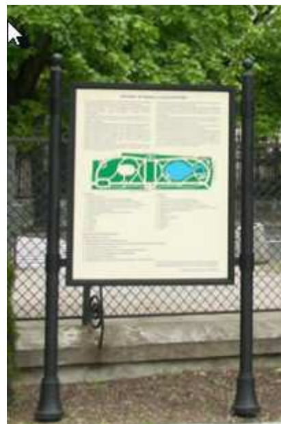
Fot. Ławka parkowa, tablica informacyjna duża, kosz na śmieci, źródł z wodą pitną.