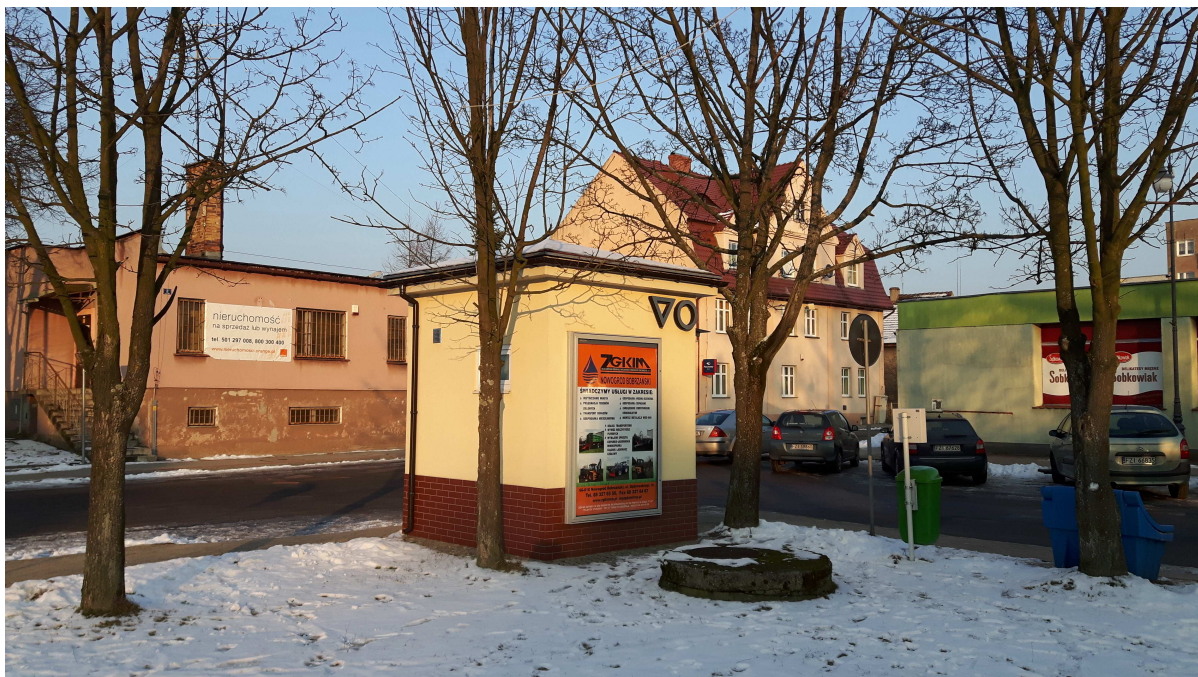
Fot. 5. Toaleta miejska na północnym skraju placu.