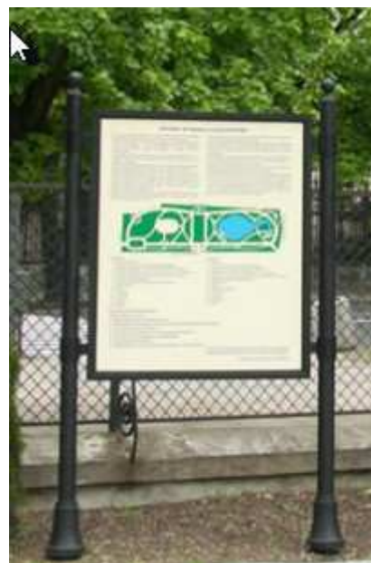
Fot. Ławka parkowa, tablica informacyjna duża, kosz na śmieci, zdroj z wodą pitną.