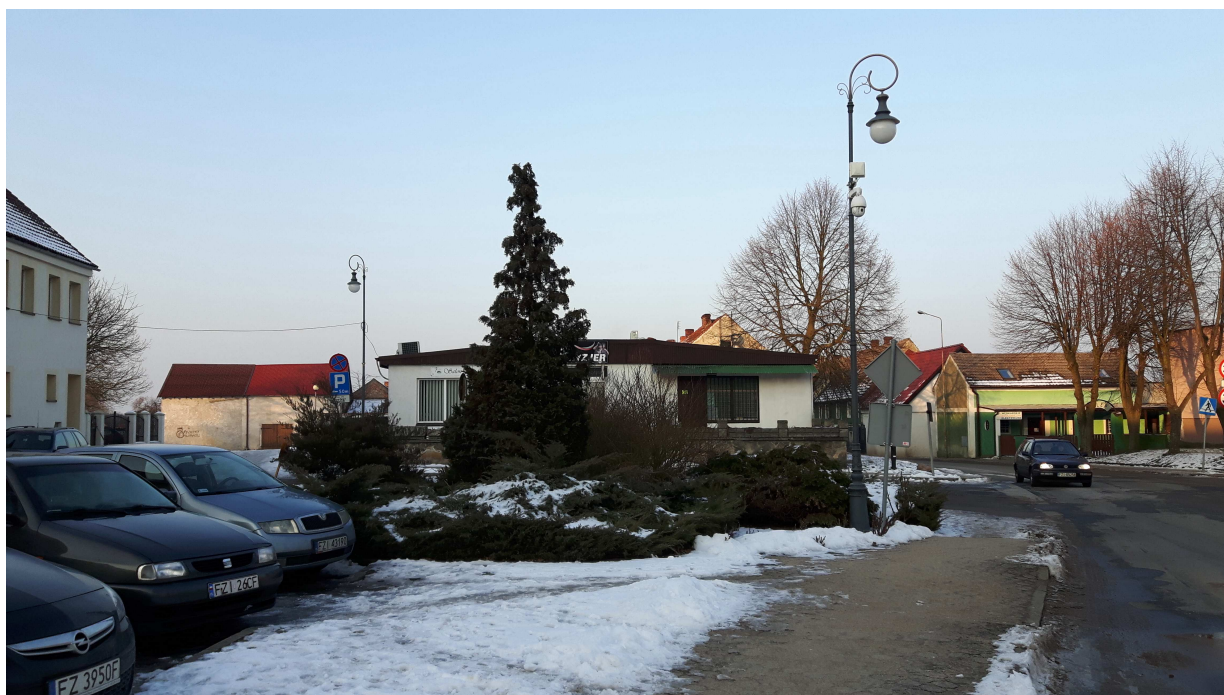
Fot. 3. Chodnik z kostki betonowej po wschodniej części placu. Rabata obsadzona krzewami iglastymi i różami.