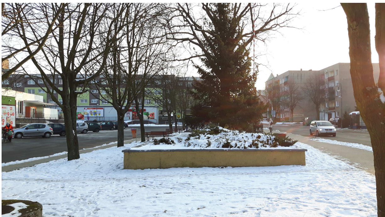
Fot. 4. Fragment kwatery obsadzonej krzewami iglastymi. Na dalszym planie świerk pospolity ( Picea abies ).