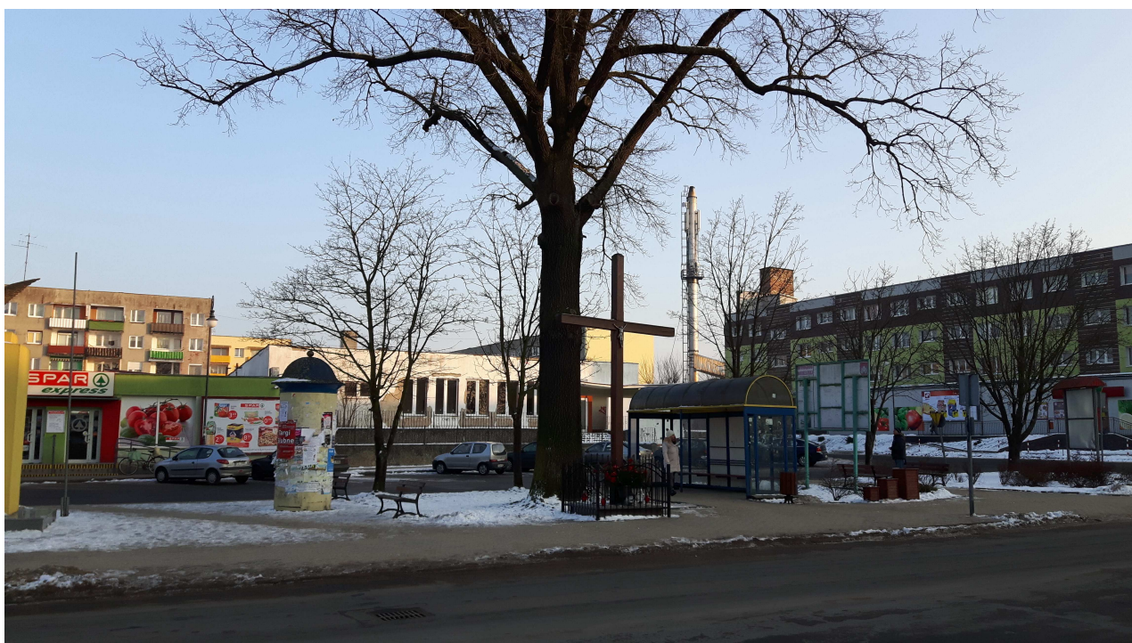
Fot. 2. Pomnikowy dąb szypułkowy. Na pierwszym planie krzyż przydrożny.