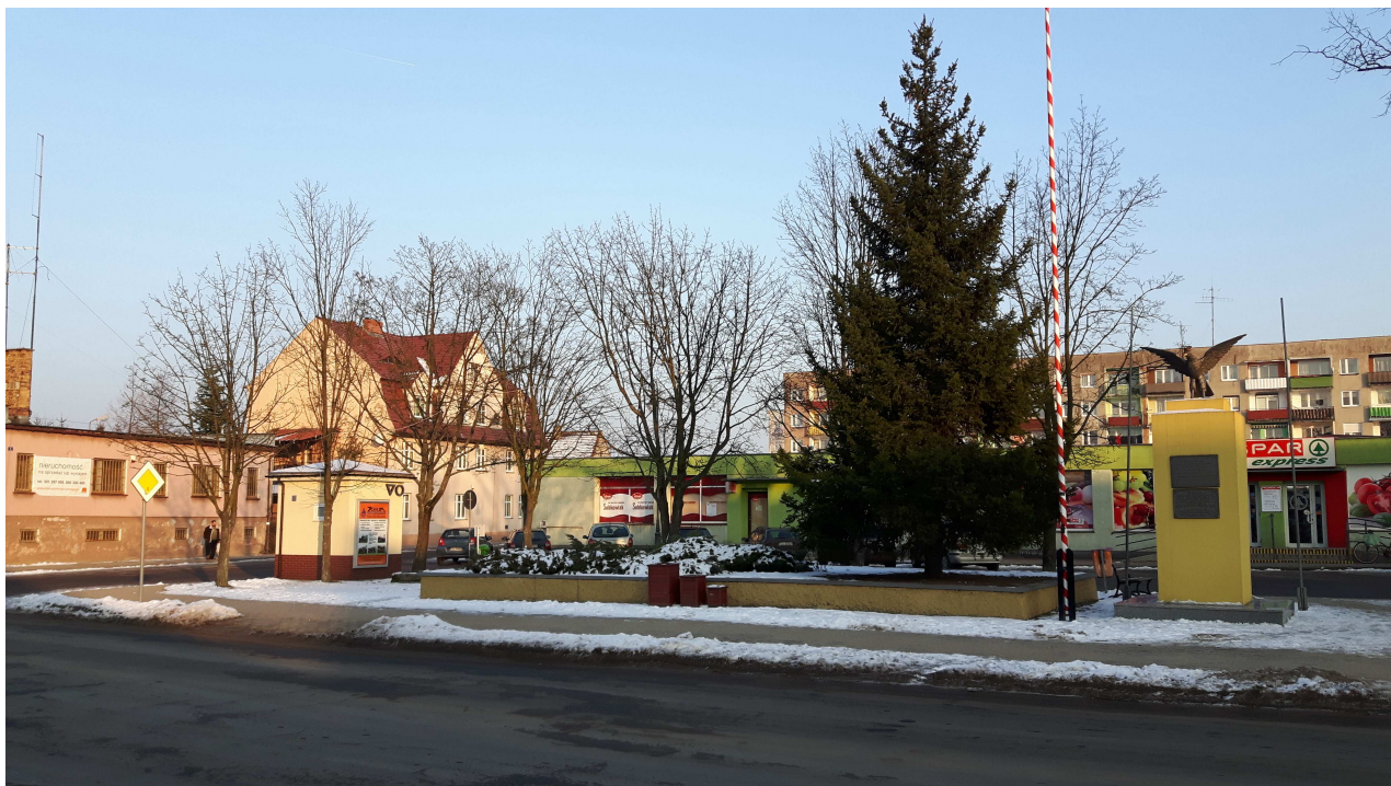
Fot. 1. Pomnik w centralnej części placu.