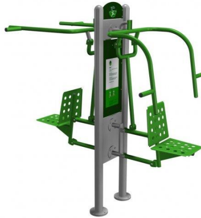
Rys. nr 1

umocowanej w gruncie przykręcany słup nośny za pomocą śrub systemowych. Urządzenie winno być wykonane zgodnie z powyższym opisem. Poglądową wizualizację stanowi rysunek nr 1.