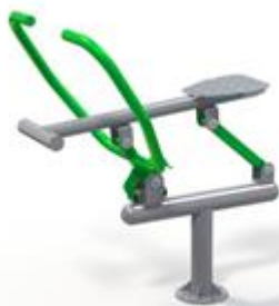
Rys. nr 1