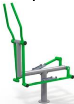
Rys. nr 1

Urządzenie winno być wykonane zgodnie z powyższym opisem. Poglądową wizualizację stanowi rysunek nr 1.