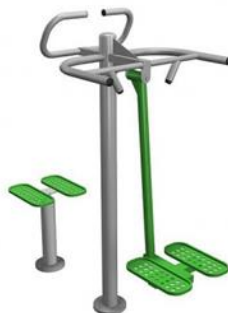
Rys. nr 1

Urządzenie winno być wykonane zgodnie z powyższym opisem. Poglądową wizualizację stanowi rysunek nr 1.