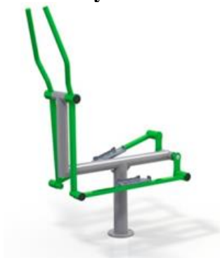
Rys. nr 1

Urządzenie winno być wykonane zgodnie z powyższym opisem. Poglądową wizualizację stanowi rysunek nr 1.