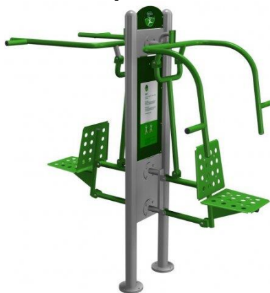
Rys. nr 1

umocowanej w gruncie przykręcany słup nośny za pomocą śrub systemowych. Urządzenie winno być wykonane zgodnie z powyższym opisem. Poglądową wizualizację stanowi rysunek nr 1.