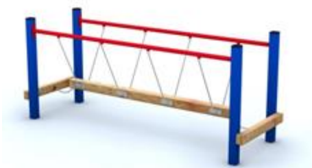
Rys. nr 1

Urządzenie wykonane zgodnie z powyższym opisem. Poglądową wizualizację pomostu stanowi rysunek nr. 1