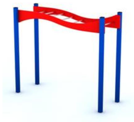
Rys. nr 1

Poglądową wizualizację drabinki poziomej stanowi rysunek nr1