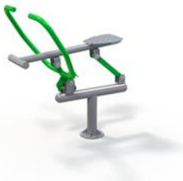
Rys. nr 1