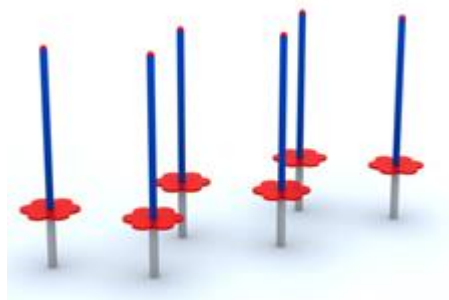
Rys. nr 1

Poglądową wizualizację słupków sprawnościowych stanowi rysunek nr 1