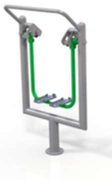
Rys. nr 1