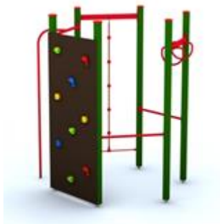
Rys. nr 1

Poglądową wizualizację zestawu stanowi rysunek nr. 1.