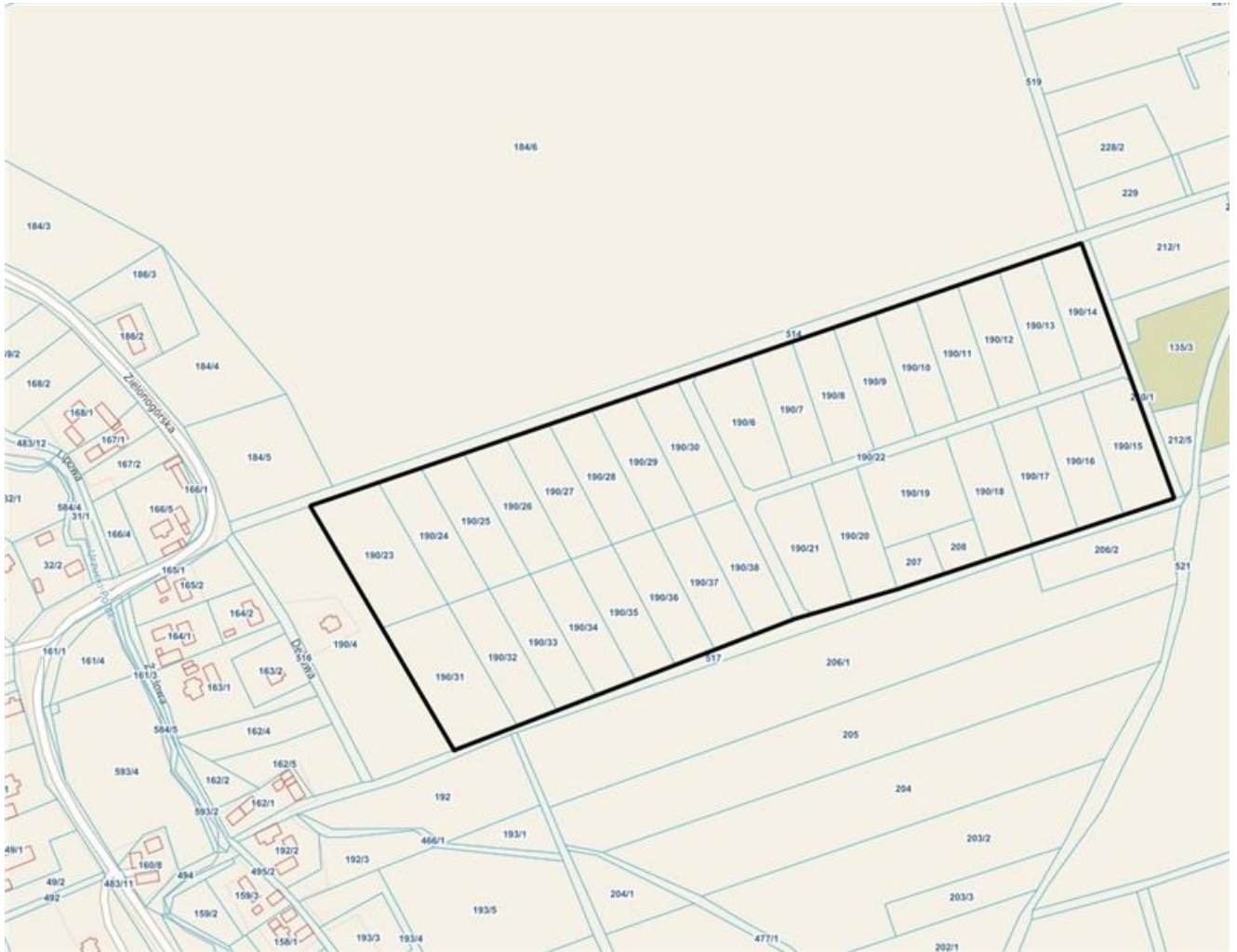
Obręb Urzuty, gm. Nowogród Bobrzański, skala 1:5000